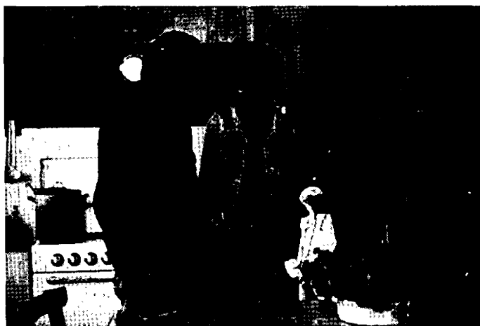
Il pleut toujours où c'est mouillé